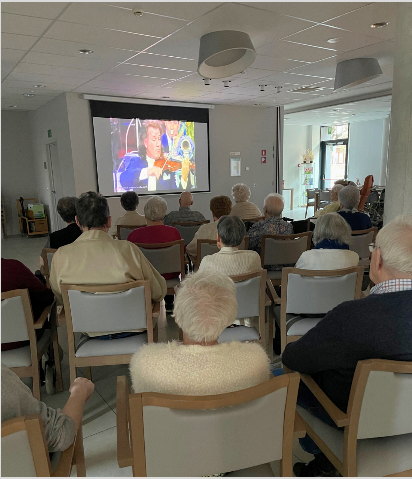
"Filmnammidag | Après-midi cinéma "André Rieu – Au Zénith de Paris"