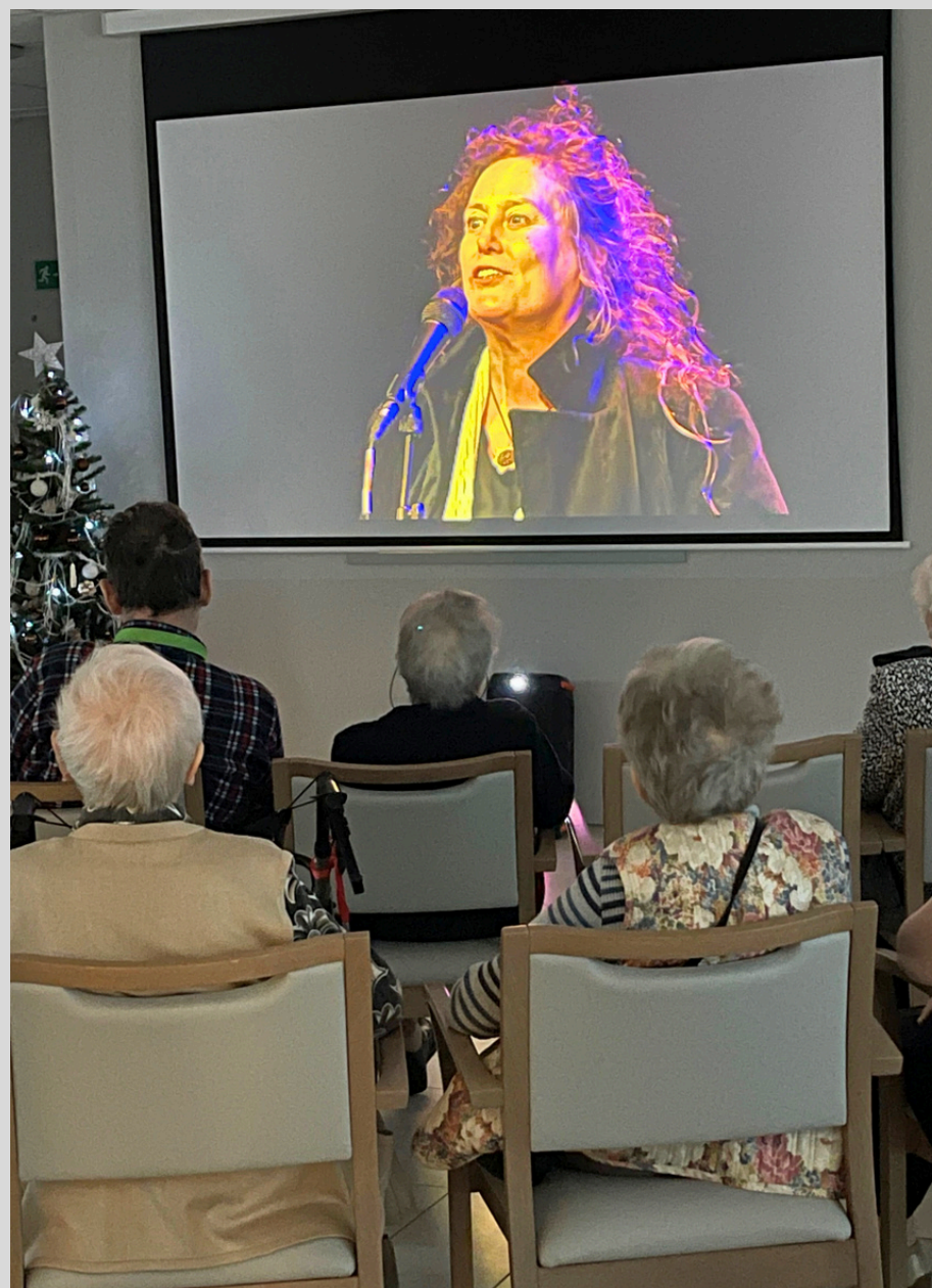
Live Uitzending | Retransmission en direct "Edith!" door Les Triadurs.