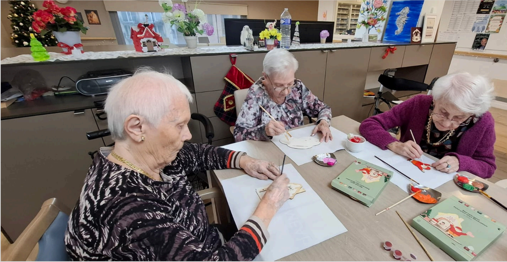
"Moment de bricolage de Noël : Fabriquer ensemble "